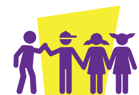
1er comité (4 personas), analizará la solicitud # 1.

El grupo de observadores deberá debatir y hacer preguntas sobre los motivos que tuvo el comité para su decisión y al final manifestar si están o no de acuerdo.