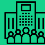
Asociaciones / empresas productivas